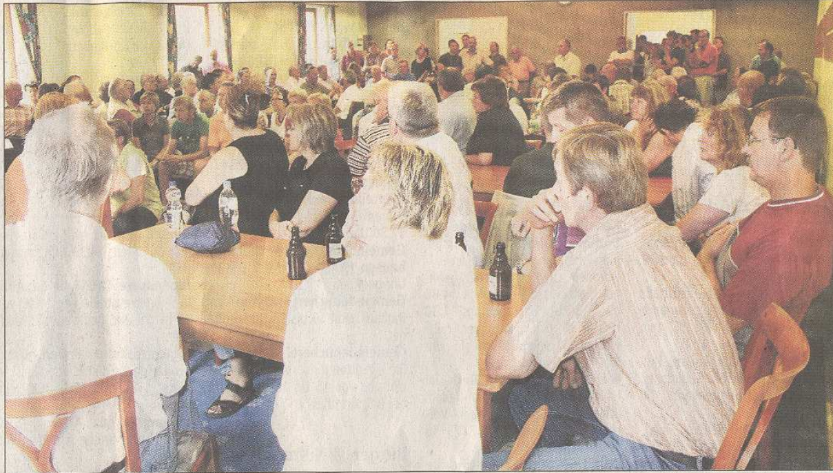
Volles Haus wegen des beantragten Sandabbaus bei der Embser Ortsausschusssitzung im Dorfgemeinschaftshaus.

Wenn, wie in diesem Fall, in einem Feld- und Waldge-