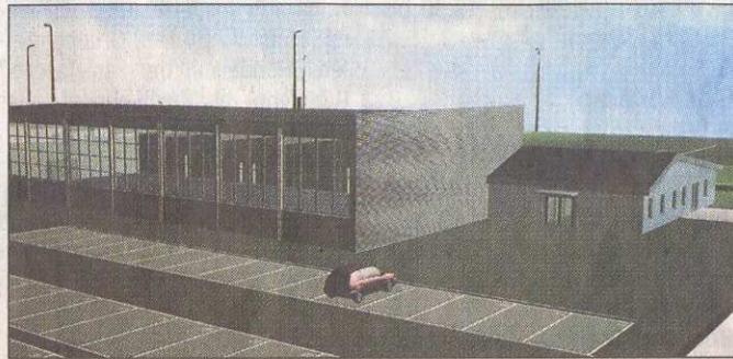
Aus dem neuen Ueser Sportzentrum auf Ex-Kasernengelände scheint nichts zu werden.

nicht öffentlicher Sitzung über den Vertragsentwurf und seine Einzelheiten gesprochen und nichts derartiges erfahren. Die Stellungnahme der GGA vom Februar sei nicht weitergeleitet worden. Die neuen Energiesparrichtlinien hätten doch auch den Investoren schon länger bekannt sein müssen, meint der SPD-Fraktionschef. Er bringt wieder den alten Plan der SPD ins Gespräch, statt einer teuren Sanierung der Schulturnhalle in Uesen dort eine neue, größere Halle zu bauen, die teilbar sei, Schule, Kindergarten