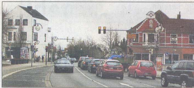
Diese zwei Häuser sind bereits von der Stadt für den Abriss erworben worden.

Bürgermeister Uwe Kellner hielt dagegen, die Umwandlung der Kreuzung zum Kreisel laufe nach Bebauungsplanverfahren mit Auslegung der Pläne, Beteiligung der Öffentlichkeit, öffentlicher Beratung und Entscheidung. Werner Meinken (SPD) erinnerte an diverse öffentliche